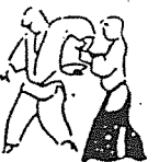
Sankyo Kote hineri